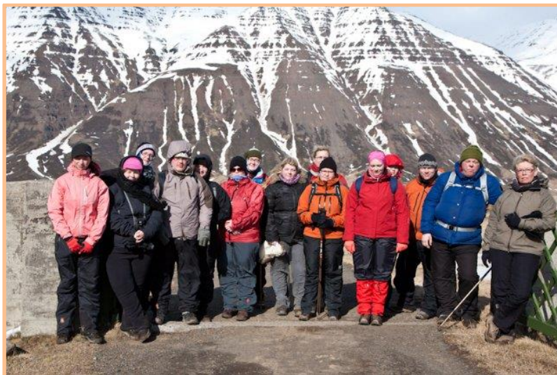
Útivist og upplifun, dúðuð og sæl.

Um haustið var hafinn undirbúningur að endurskoðun á kennslufyrirkomulagi, en frá árinu 2010 höfðu námskeið deildarinnar verið boðin í þriggja vikna lotum, eitt og eitt í senn.