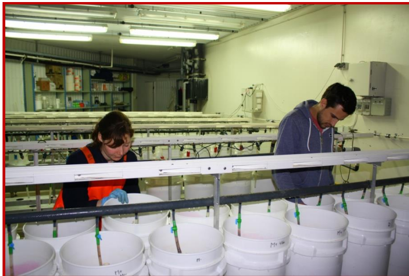
Rannsóknir í fiskeldi og fiskalíffræði.

Á árinu tóku sérfræðingar skólans þátt í 34 rannsókn- og þróunarverkefnum, sem styrkt voru af innlendum og erlendum samkeppnissjóðum eða með beinu framlagi frá ríkinu. Fjöldi styrktra verkefna jókst frá árinu 2011 en þá voru þau 28. Tekjur af rannsóknaverkefnum og þróunarvinnu voru um 96 milljónir. Í þeirri upphæð eru talin með framlög ríkisins og aðrar tekjur af bleikju-kynbótaverkefninu. Um 78% af þessum tekjum eru vegna rannsókn- og þróunarstarfsemi innan Fiskeldis- og fiskalíffræðideildar.