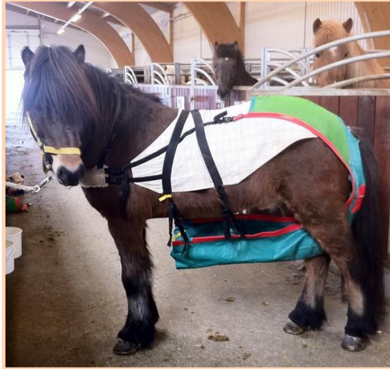
Fóðurnýting – rannsóknarverkefni á Hólum.

mælingar á álagi þar sem líkt var eftir keppni í skeiði. Einnig fór fram rannsókn á sviði fóðurfræði sem fjallaði um nýtingu fosfórs hjá hrossum eftir aldri.