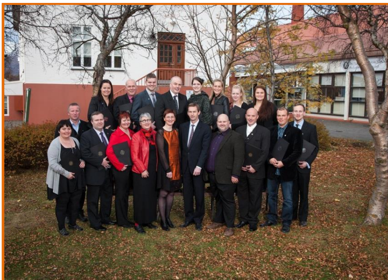
Brautskráning að hausti 2012