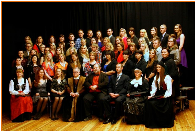
Brautskráning að vori 2012

Á árinu brautskráðust 93 einstaklingar frá Háskólanum á Hólum. Fjöldi brautskráðra hefur vaxið á undanförunum árum, en stóð í stað milli áranna 2011 og 2012, að hluta til er það vegna breyttrar skipunar náms í hestafræðideild. Á árinu útskrifuðust 49 nemendur úr ferðamáladeild, 12 úr fiskeldis- og fiskalíffræðideild og 32 úr hestafræðideild.