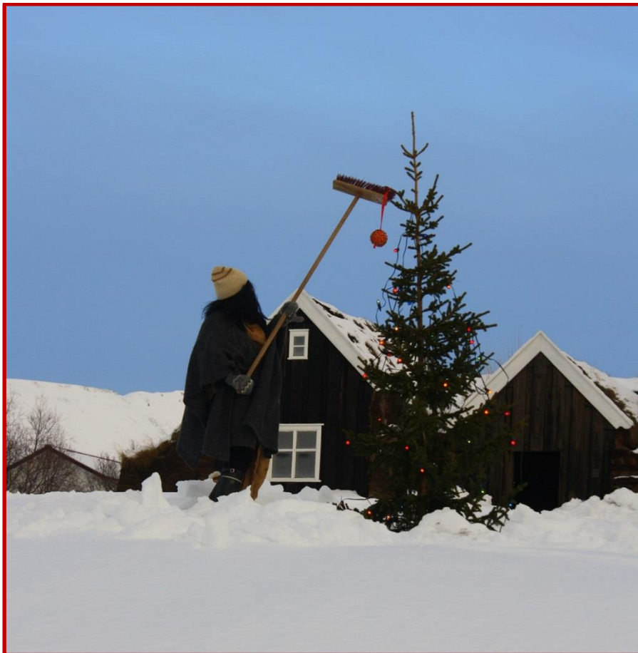
Viðburðarstjórnun, jólatré skreytt að hætti grýlu 1. desember.

Kynningarmál skólans voru einkum skólaheimsóknir í framhaldssóla, móttaka hópa og einstaklinga á Hólum auk þátttöku í Háskóladeginum, Hestatorginu á Landsmóti hestamanna og Degi menntunar í ferðaþjónustu. Auk þess var opið hús í Háskólanum á Hólum þann 1. desember þar sem nemendur og kennarar skólans tóku á móti gestum og kynntu starfsemi skólans.