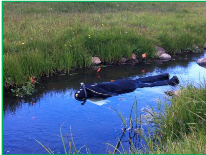
Fylgst með atferli laxfiska.

Deildin hefur um margra ára skeið verið í samstarfi við Sjávarútvegsskóla Háskóla Sameinuðu þjóðanna um kennslu í fiskeldisfræðum. Annarsvegar kennir deildin annað hvert ár sérhæft sex vikna námskeið um fiskeldi, sem er hluti af námi þeirra nemenda sem koma til Íslands, auk þess að leiðbeina nemendum í þriggja mánaða rannsóknarverkefnum. Þessi hluti námsins var í boði á skólaárinu 2011 – 2012. Hinsvegar hefur deildin komið að sérhæfðum námskeiðum í fiskeldi sem haldin eru víða um heim og voru tvö slík námskeið kennd á árinu 2012.