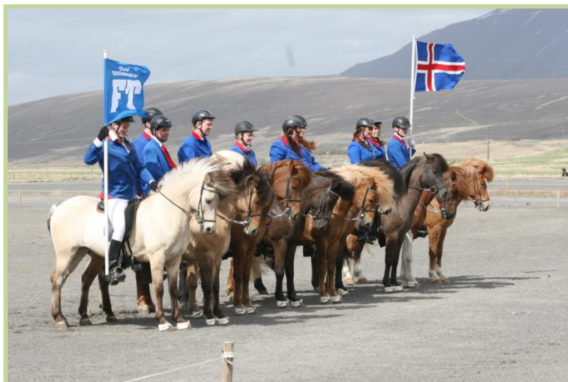
Sýningarlok við brautskráningu.

Sem hluti af samstarfi opinbera háskóla var í desember 2011 undirritaður samningur um gagnkvæman aðgang nemenda. Nemendur hófu að nýta sér þennan samning nær samdægurs, á árinu sóttu 18 nemendur frá öðrum opinberum háskólum námskeið við Háskólann á Hólum, og oft fleira en eitt námskeið hver nemandi, alls 25 námskeið. Á haustdögum var undirritaður samningur um samnýtingu kennsluskyldu kennara. Sá samningur kemur Háskólanum á Hólum mjög vel og hafa kennarar skólans komið að kennslu við Háskólann á Akureyri, auk þess sem kennarar frá Háskóla Íslands hafa komið að kennslu við Háskólann á Hólum.