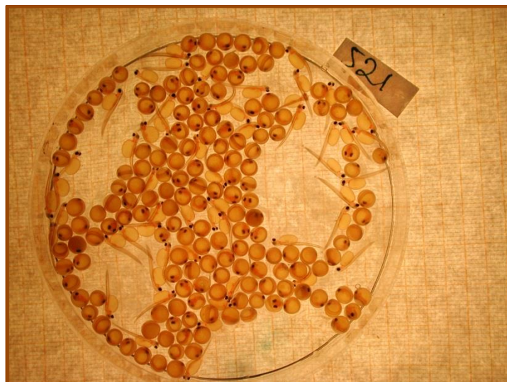
Lengi býr að fyrstu gerð – bleikja að klekjast úr eggj.