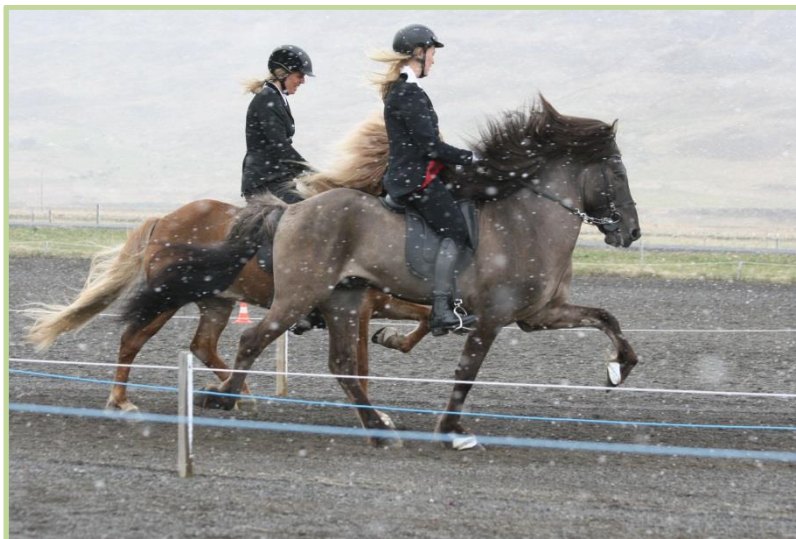
Frá reiðsýning að vori.

Nemendur tóku þátt í ýmsum viðburðum innan og utan skólans s.s. hestamótum, kennslusýningu á Sauðárkróki, og æfingakennslu í reiðmennsku í samvinnu við grunn- og framhaldsskóla héraðsins.